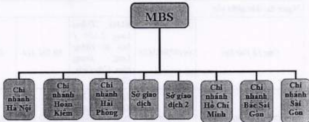
Hình 4: Mạng lưới của công ty.